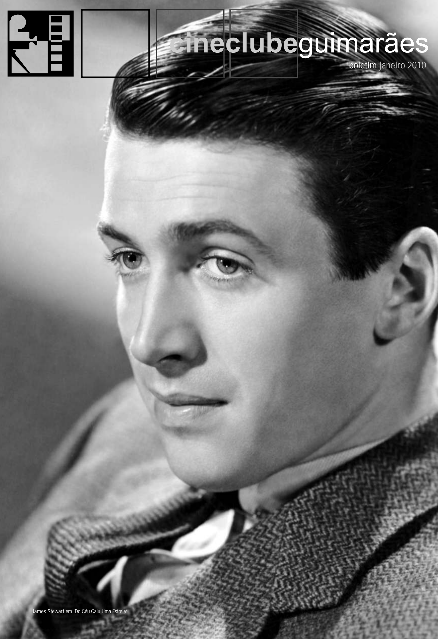
James Stewart em 'Do Céu Caiu Uma Estrela'