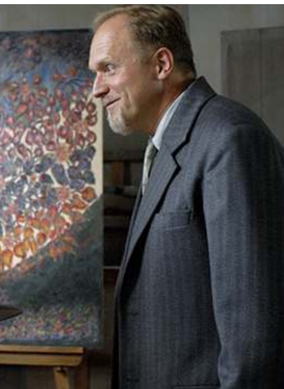
Sessão 2767 21 JANEIRO 2009 (Quinta) GA, Centro Cultural Vila Flor · 21h45